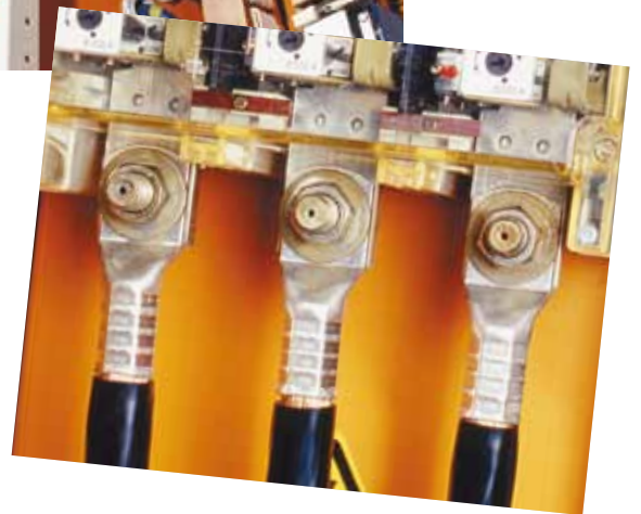
Klauke Rohrkabelschuhe eignen sich für nahezu jede Anwendung rund um Kupferleiter.