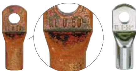
4. Glühen 5. verzinktes Endprodukt