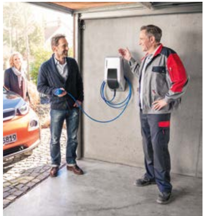
Ladestationen, Ladekabel und Zubehör unter www.ferratec.ch